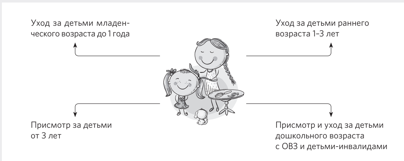
Схема. Какие трудовые функции может выполнять няня по новому профстандарту

Некоторые требования к навыкам и знаниям, перечень трудовых действий нянь, работающих в разных группах, могут совпадать.